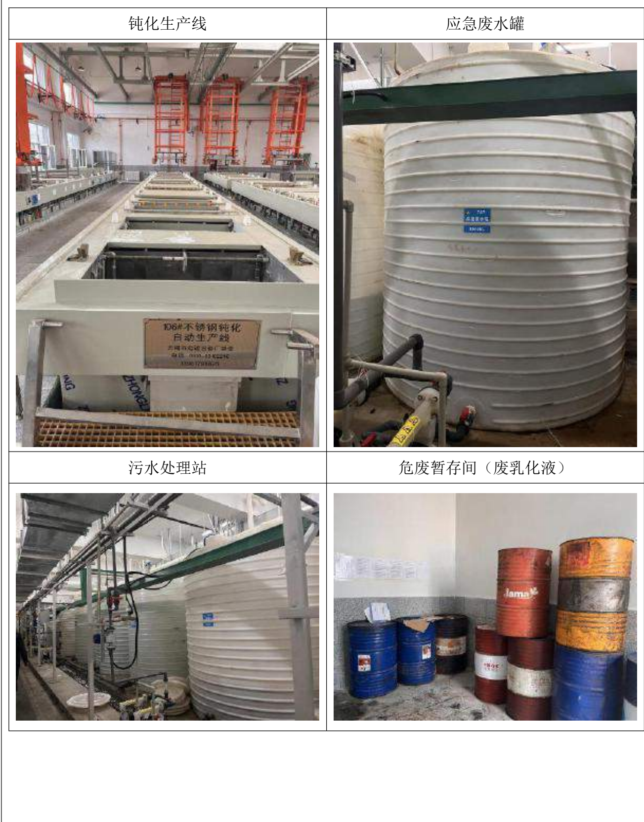
附图1、项目现场照片