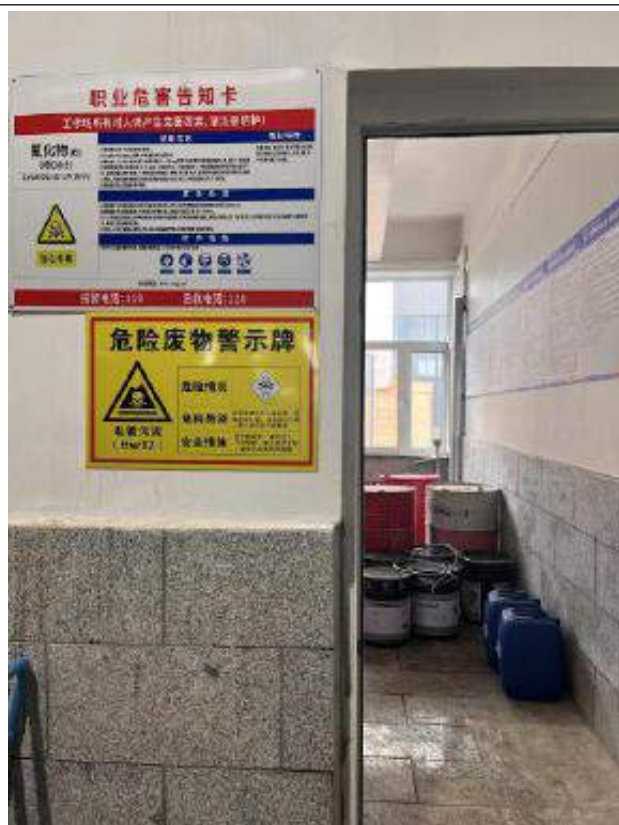
危废暂存间（电镀污泥）