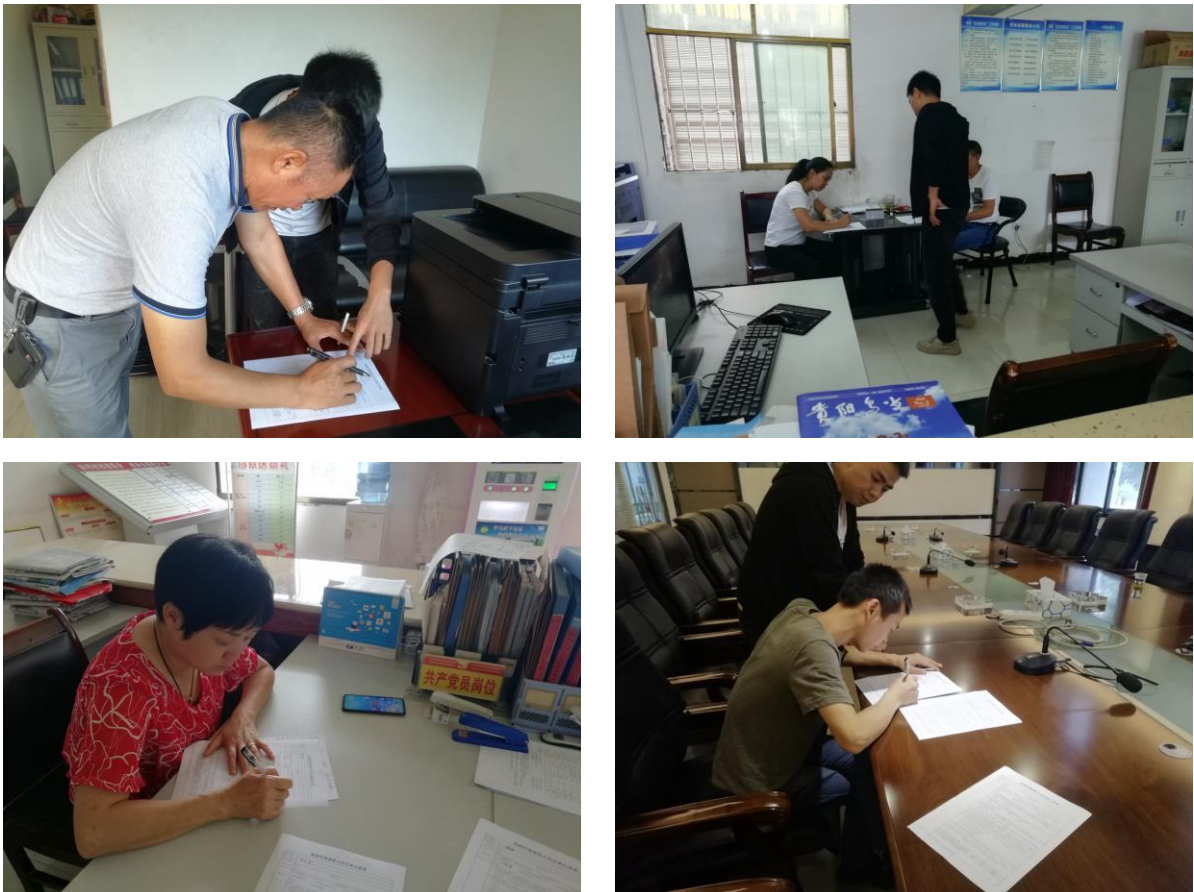
图 4-1 人员访谈过程图