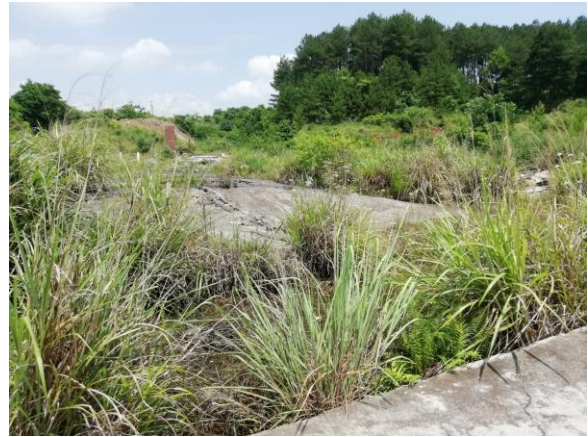
贵广高铁临时拌合站（已废弃）